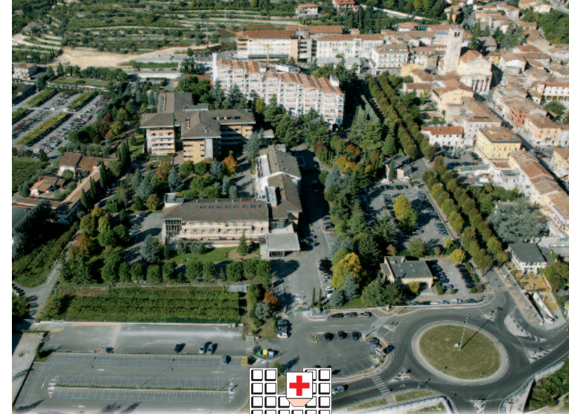
Ospedale "Sacro Cuore - Don Calabria"